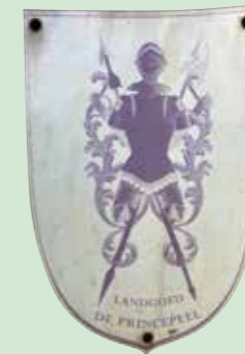
Oud familiewapen Princepeel.