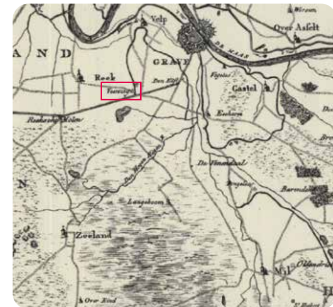
Kaart rond 1800. Langenboom is het eerste Peeldorp dat ontstond. Toen nog niet meer dan enkele boerderijen. Huize Veenzicht in Velp bij Grave was er toen al. De Graspeel (tussen Zeeland en Langeboom) was in de winter ontoegankelijk en diende in de zomer als gemeenschappelijk weidegebied: De Meent.

De Princepeel in de voormalige gemeente Mill kent een rijke historie (zie kader Van Ophoven). Café-restaurant 't Amanshof in Wilbertoord is een directe verwijzing naar de ontginning van de Princepeel. Werkers kregen een tuintje (een hofke) toegewezen van de kasteelheer. De tuintjes waren geen bezit, maar allemans hofkes.