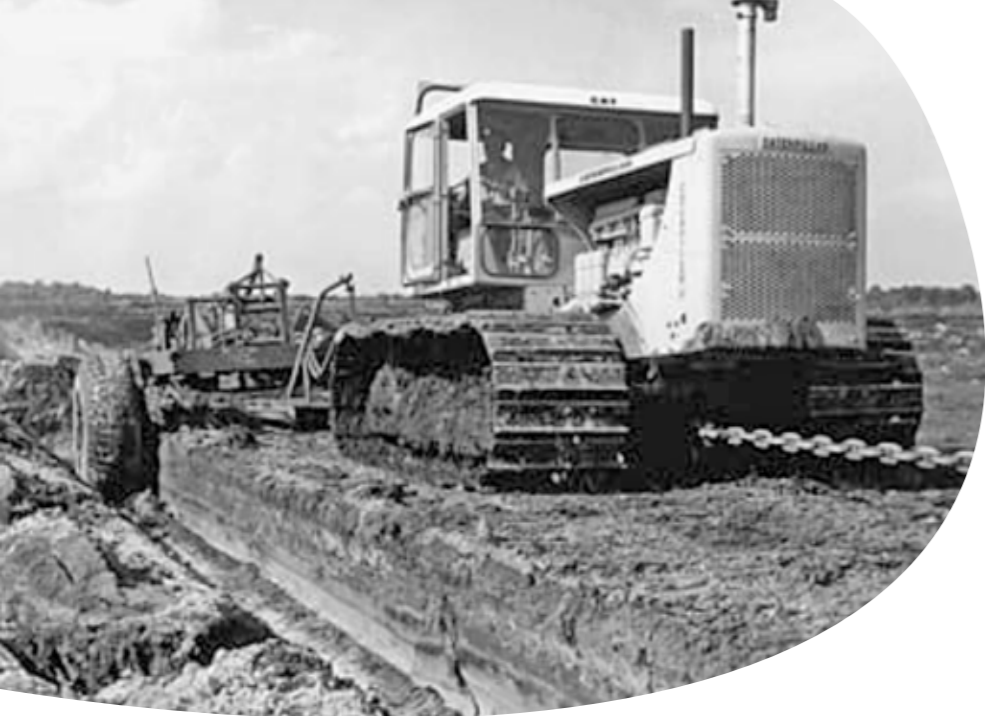
1966: Laatste gesubsidieerde ontginning van de Peel in Heibloem.