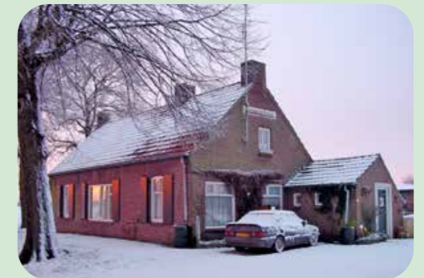
Dominicushoeve in De Princepeel Genoemd naar de ontginner van de Princepeel: Dominicus van Ophoven. Volgens de laatste bewoner van deze hoeve (inmiddels afgebroken) herbergt de grond erachter een massagraf met veel Belgische trekpaarden. Die paarden werden letterlijk doodgewerkt om de Peel te ontginnen.