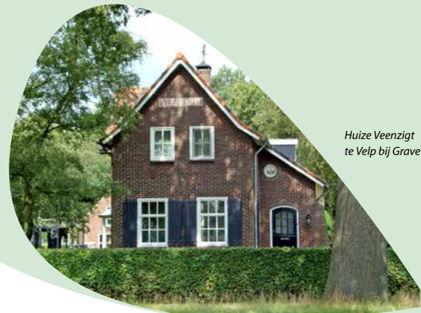
Huize Veenzicht te Velp bij Grave

Het woord 'Peel' roept meteen beelden op van het zuidelijke deel ervan. Dit met dank aan de streekromans van Toon Kortooms en Antoon Coolen. Toon Kortooms is geboren en getogen in Deurne op de grens van het latere Peeldorp Griendtsveen. Hij beschreef de Peel ten tijde van de turfwinning. 'Mijn kinderen eten turf', is de titel van een van zijn boeken. Een titel die aangeeft hoezeer de turfwinning allesbepalend was voor de streek. Dit terwijl kinderen uit de huidige Peel, vaak niet eens meer weten wat turf is. Kortooms heeft vooral met veel humor geschreven over die tijd, maar of er voor de werkers zoveel humor te beleven viel, is maar zeer de vraag. Het was lomp zwaar werk, dag-in-dag-uit, van licht tot donker, zes dagen in de week, daarbij continu geteisterd door zwermen muggen in soorten en maten. Turfstekers van rond de 40 jaar, zagen eruit alsof ze de 90 ruim gepasseerd waren. Dat ligt voor een deel aan de kleding van die tijd en vooral aan het feit, dat ze al zo jong 'opgebrand' waren.