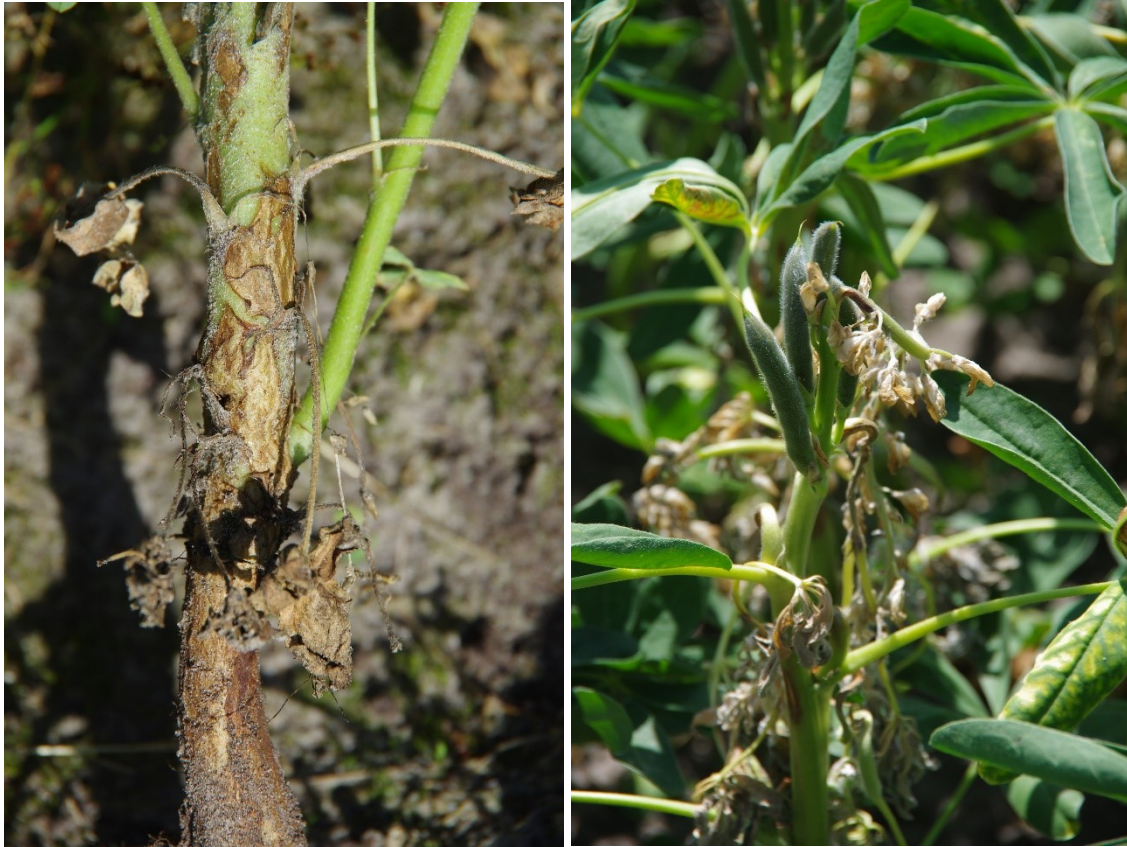
Figuur 4-11: Links: onbekende stengelaantasting, mogelijk veroorzaakt door Pleiochaeta; rechts; aantasting door anthracnose in het zomerlupineras Sulimo