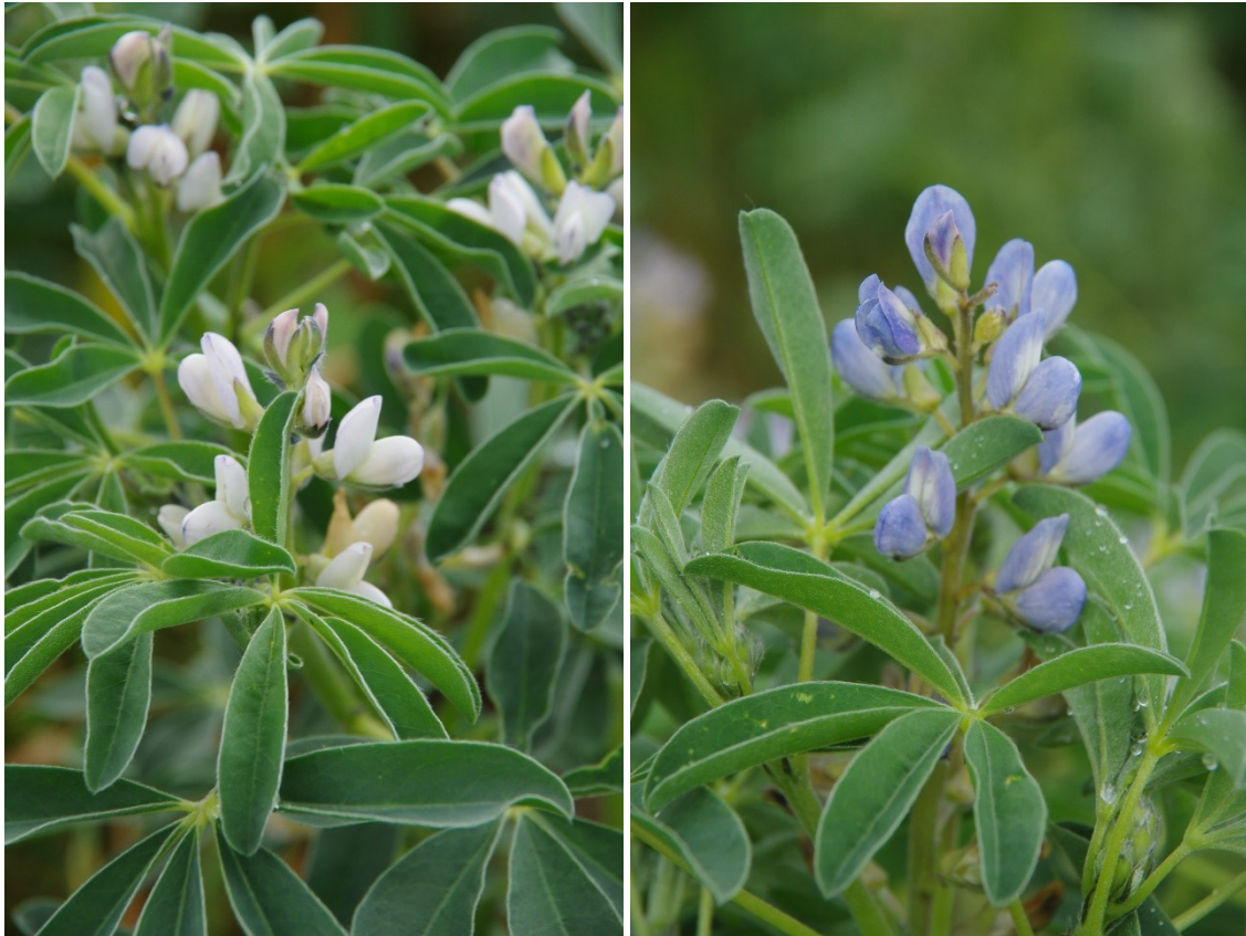
Figuur 4-6: Links: Rumbo Baer witbloeiend, en rechts de Chileense lijn Blu-21-62-48-19