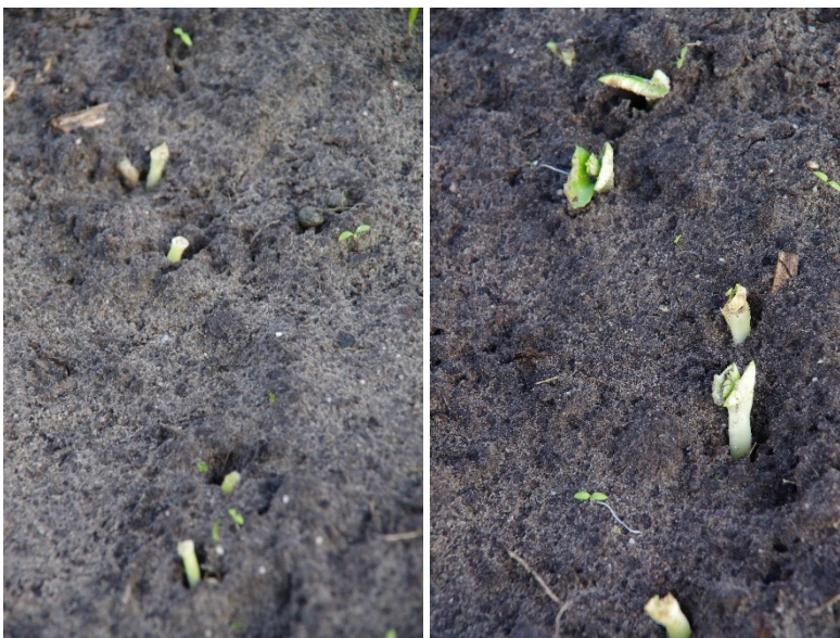
Figuur 4-3: Links en rechts: dassenvraat kiemplanten in Rumbo Baer, 2 e zaaimoment op 29 november.