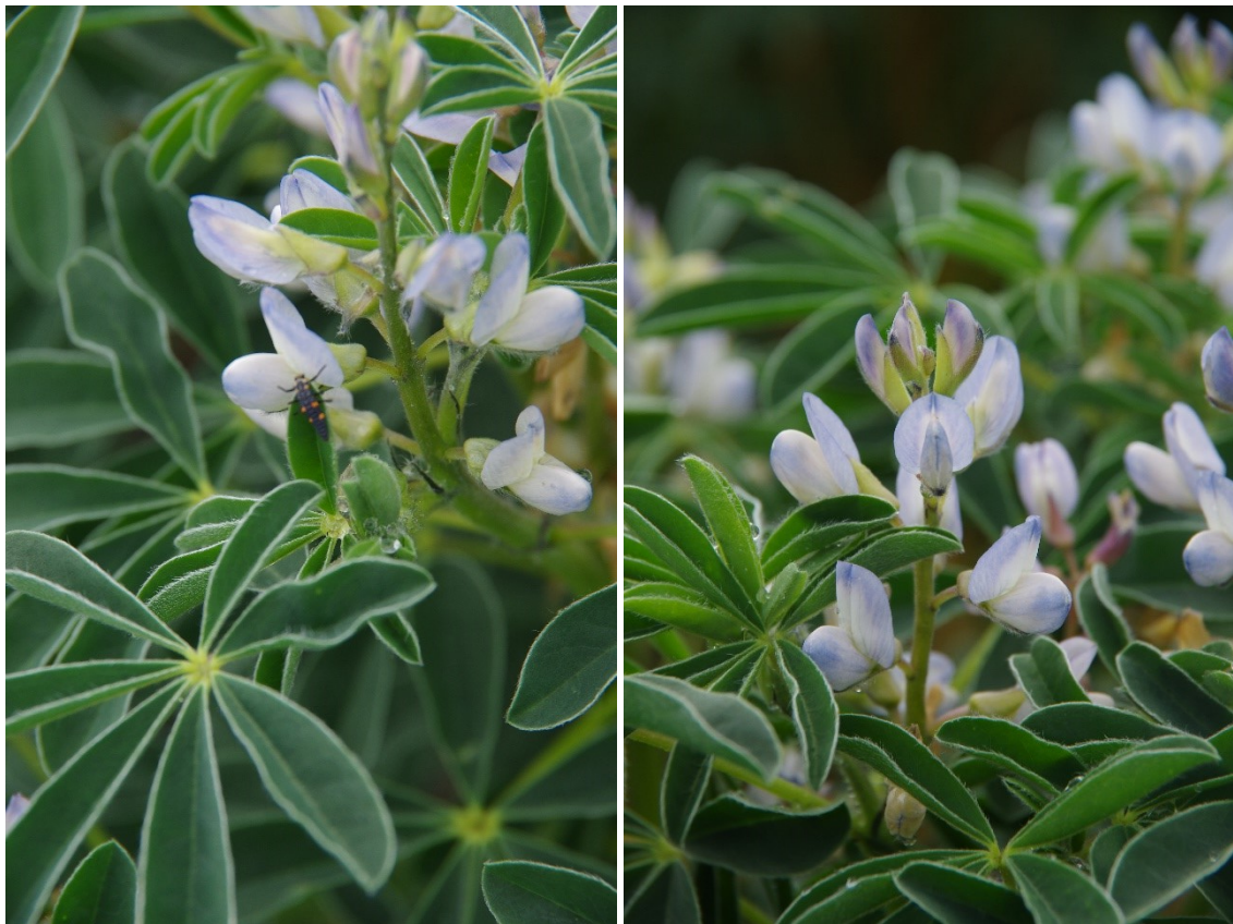
Figuur 4-5: Links: Orus met lieveheersbeestje, rechts: Magnus (19 mei)