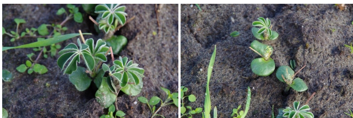
Figuur 4-1: Links: vraatschade Orus; rechts: vraatschade Magnus in 1 e zaai op 29 november