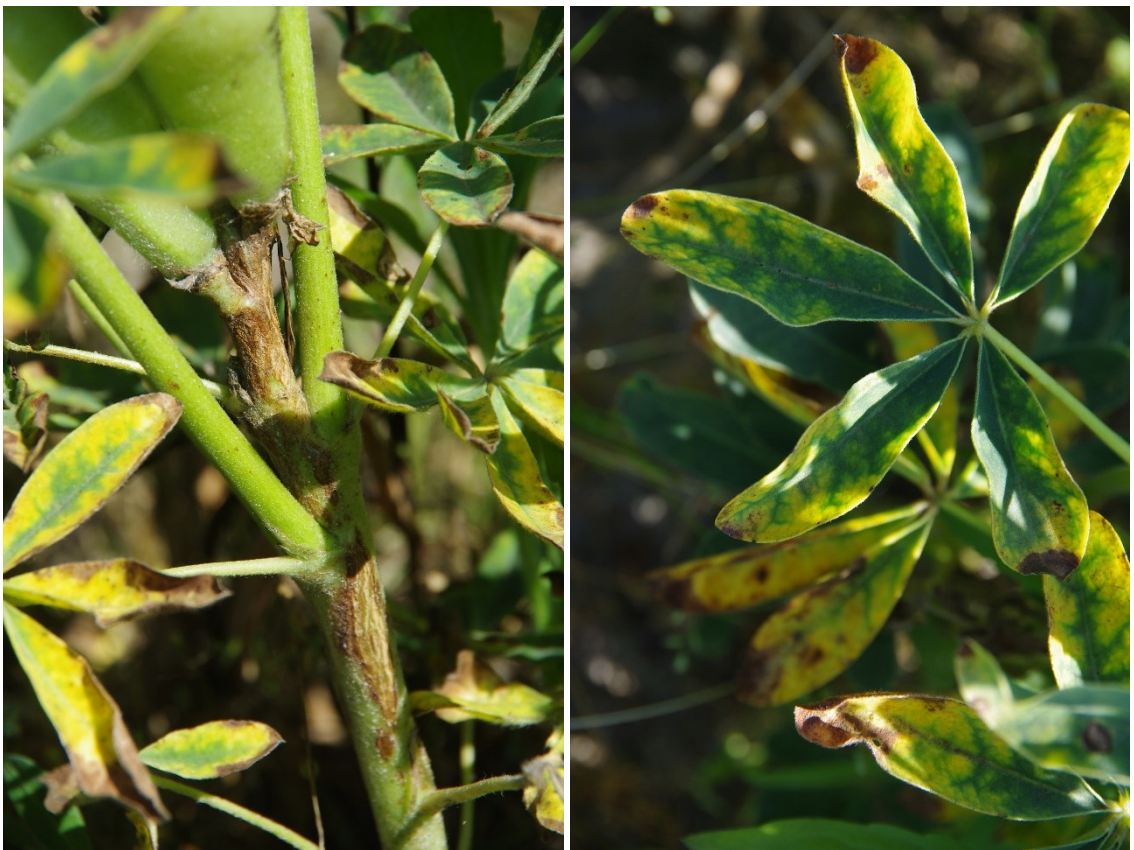
Figuur 4-10: Pleiochaeta setosa aantasting in Rumbo Baer