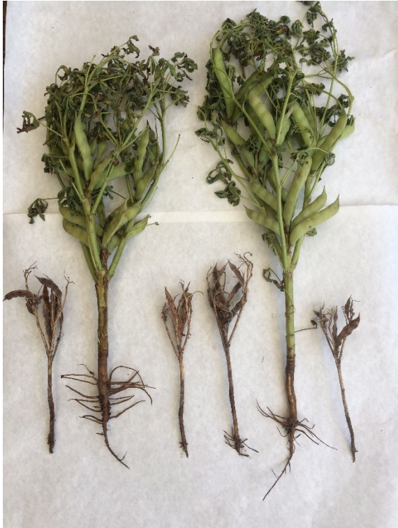
Figuur 4-13: Enorm verschil in gewasontwikkeling in de proeven op dalgrond (planten met zeer sterke dwerggroei en zonder productie) en op de dekzandgrond waar de proeven in deze rapportage zijn uitgevoerd (ontwikkeling op 16 juli 2022).

In de beoordeling van de opbrengst is het belangrijk om ook de resultaten van de teeltproef op dalgrond te vermelden. Deze proef is elders uitgebreider beschreven (Cuijpers, 2023) , maar hier heeft helaas geen oogst plaats gevonden: door verslemping en waterstagnatie trad hier sterke dwerggroei op, met nauwelijks peulvorming .