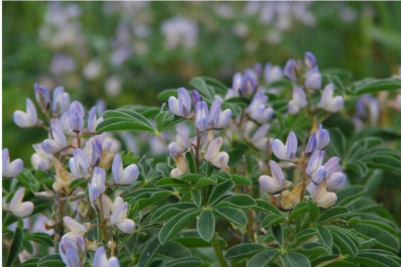
Figuur 4-4: Bloei Ulysse, 19 mei