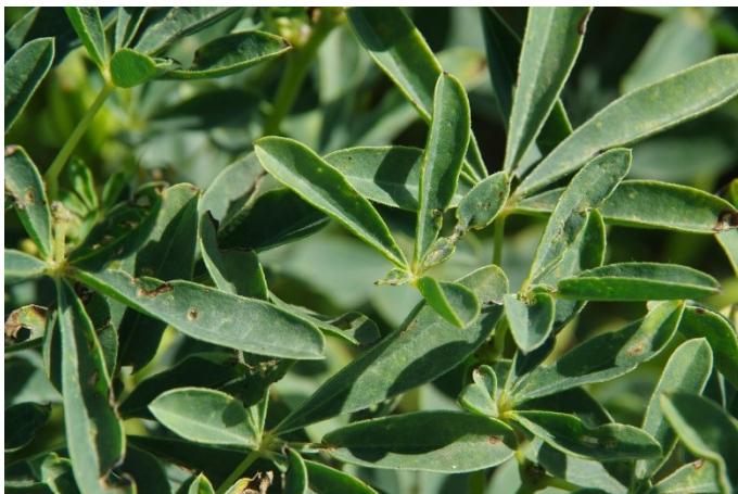
Figuur 4-12: Schade door rozenkever in Rumbo Baer. Behalve met het blad, kunnen volwassen rozenkevers zich ook voeden met bijvoorbeeld bloemknoppen.

In zomerlupine komen plagen nauwelijks voor. Met name in bittere lupinesoorten, zoals Andeslupine, wordt wel de lupineluis gezien. In de winterlupine in deze proefopzet lijkt de plaagdruk wat hoger, met zowel aantastingen door luizen, als door bijvoorbeeld rozenkevers. De druk is in een aantal gevallen zo hoog, dat er vermoedelijk ook een effect op de opbrengst is opgetreden.