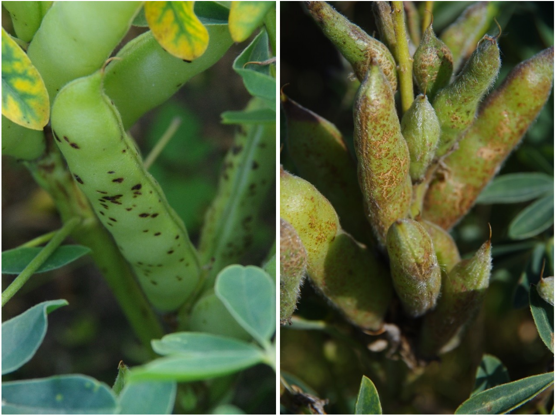
Figuur 4-9: Links: Pleiochaeta op peul in Magnus (13 juli) en eerder op lijn Blu-21-61-47-19 (23 juni)