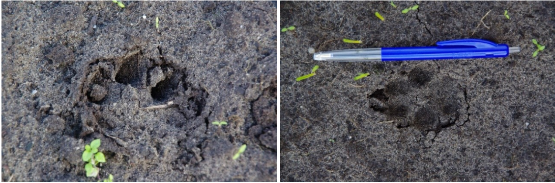
Figuur 4-2: Dassensporen