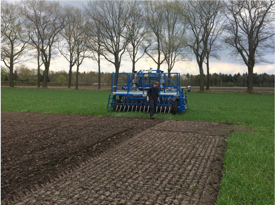
Figuur 3-1: Proefveldzaamachine met werkbreedte van 3 meter.