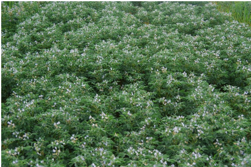
Figuur 4-7: Mooie volle stand van het gewas (Orus)