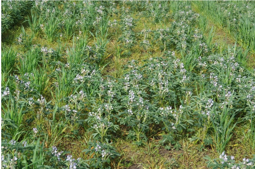
Figuur 4-8: Dunne stand van het gewas door vraat aan het begin van het groeiseizoen (Ulysse)